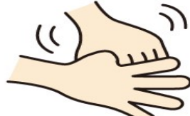
⑤親指を手のひらでねじるように 5秒間ゴシゴシ洗う