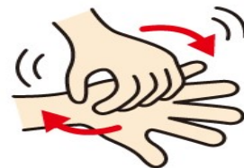
③指先やつめの間も渦を描くように 5秒間ゴシゴシ洗う