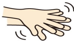
②手の甲を伸ばすように 5秒間ゴシゴシ洗う