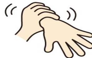
⑥手首も忘れずに 5秒間ゴシゴシ洗う