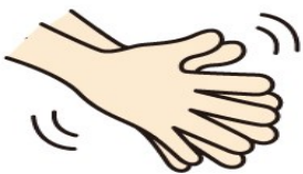
①手のひらをあわせて 5秒間ゴシゴシ洗う

最初に手を水でぬらし、石けん（あれば液体石けん）をまんべんなく手にひろげて泡立たせます。