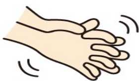
④指の間も十分に 5秒間ゴシゴシ洗う