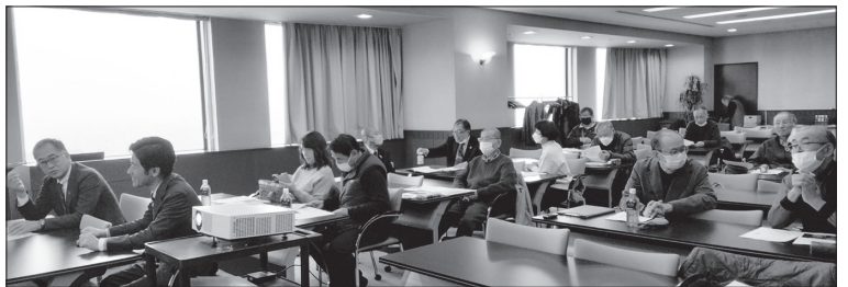
▲2025年移植セミナー会場

移植を待つ身にはとても為になる話題でしたので、移植を待つ多くの患者家族に聞いて欲しいと2026年度移植セミナーも開催する予定です。