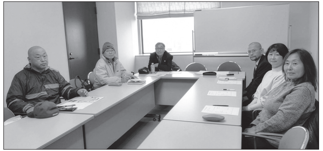
▲第3回組織強化委員会様子

同日午後、同じ会場で「 第3回広報委員会 」も開催されました。愛腎協機関誌である道標134号の進捗状況及び校正作業が行われた後、名古屋での移植セミナーへの動員協力依頼が執行部より各委員へ要請されました。