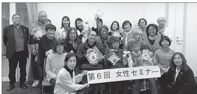
▲第 6 回女性セミナー参加者の皆さんでの集合写真