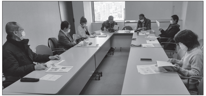
▲第3回広報委員会様子