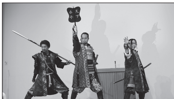
▲愛腎協第 13 回大会を盛り上げるグレート家康公「葵」 武将隊