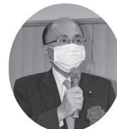
根本幸典 衆議院議員