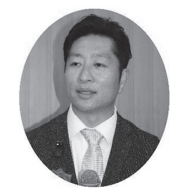
中村竜彦 県議会議員