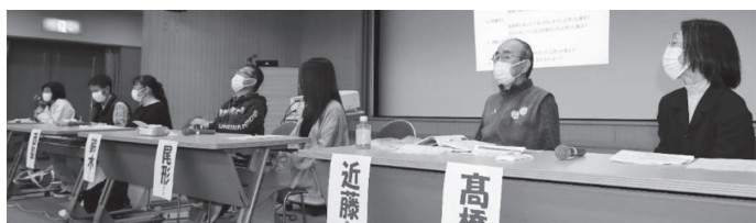
移植者によるフリーディスカッション。皆元気いっぱいでした