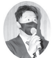
杉浦正和 県議会議員