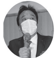
丹羽洋章 県議会議員