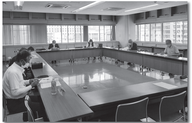
第1回本部長会議風景