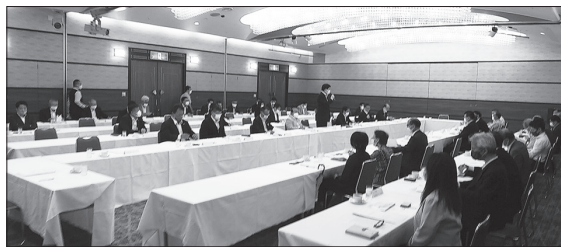
自由民主党愛知県総支部連合会厚生部会との懇談会

いつも全腎協、愛腎協の皆様にお話を伺っています。国、県、市の要望に対してしっかり応えていきたいと思えます。リハビリについては昨年も要望がありました。継続してやっていきたいと思えます。