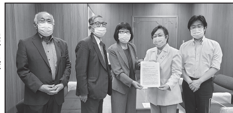
名古屋民主市会議員団と記念撮影