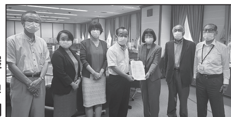
日本共産党名古屋市会議員団と記念撮影

回答：現状維持である（名古屋市当局）しかし、名古屋市当局では以前から一部導入を考えているので注意喚起が必要である。