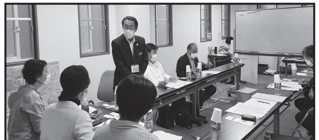
日本共産党愛知県委員会との懇談会