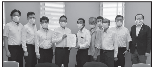
公明党愛知県本部との懇談会