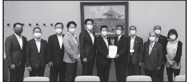
公明党県議団との懇談会

特に、今年度は新型コロナウイルスによる影響が全国規模で起きているため、愛知県における経済的な影響（税収の減少）などもあり、今年度は維持される社会保障体制も来年度に向けては影響が懸念されるため、透析患者の医療負担がない様にお願いし、また今後、 新型コロナウィルスのワクチンが出来た場合にはワクチンを打つための費用助成をしてもらえないか等、を愛知県の各県議団・県政党機関にお話をしてきました。