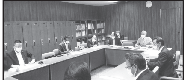
新政あいち県議団との懇談会