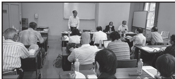
名古屋本部会議の様子

6月21日知多支部、7月5日に名古屋本部、18日は東尾張本部、19日は西三河本部、26日は東三河本部とそれぞれ各地区の施設代議員を集めての会議が行われました。