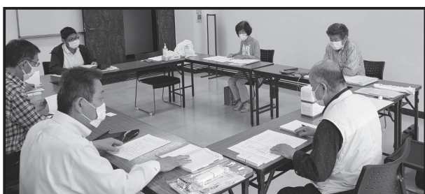
東尾張本部会議の様子