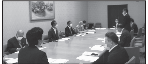
自由民主党県議団との懇談会