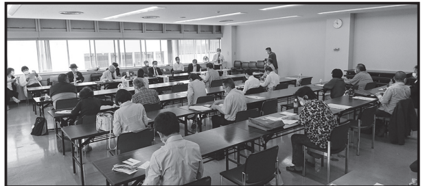
代議員総会開催風景

※ 50 周年記念タオルの発送が始まりました。お手元に届くまでしばらくお待ちください。