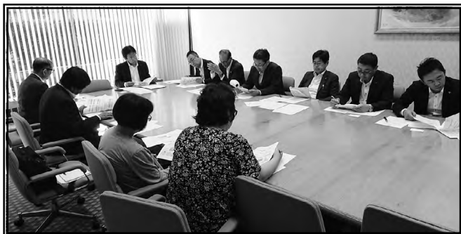
自民党県議団懇談会