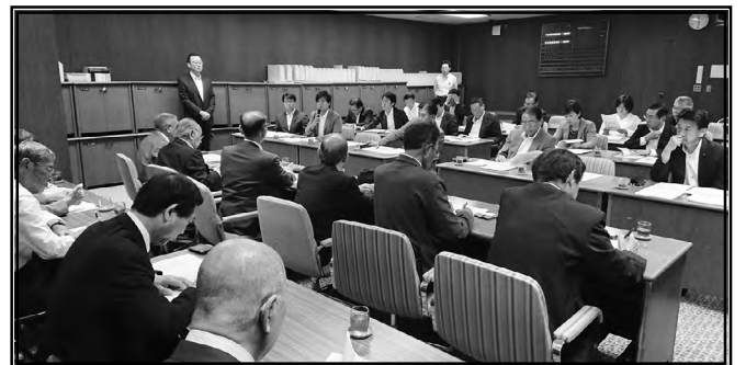
新政あいち県議団懇談会