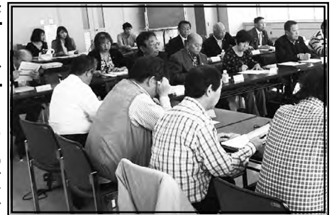
第2回本部長会議風景