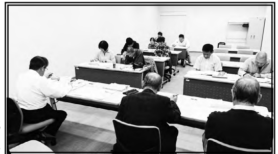
尾張本部上期代議員会議風景