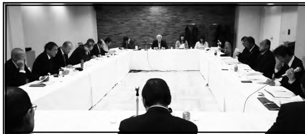
東海ブロック会議風景