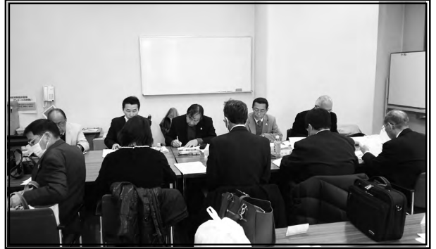
第 3 回理事会の風景