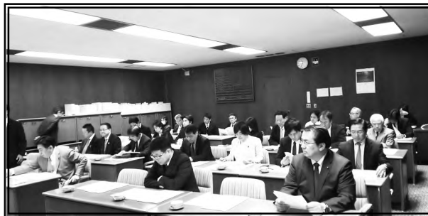
新生あいち愛知県県議会議員団