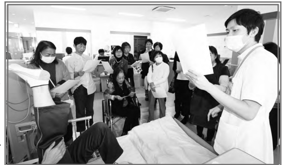
透析中の運動療法の説明を受ける女性部の皆さん

平成 28 年 11 月 22 日（火）に女性部が「城西病院」を訪問しました。参加者は 16 名でした。透析室・病棟・リハビリ室の見学。透析中の運動療法の説明を受け、実践しました。炭酸泉による治療体験もしました。隣接する「じょうさいグループホーム」も見学させていただきました。これからも、先進医療現場を視察して透析生活の向上ができることを会員の皆様に広めていきたいと思いました。