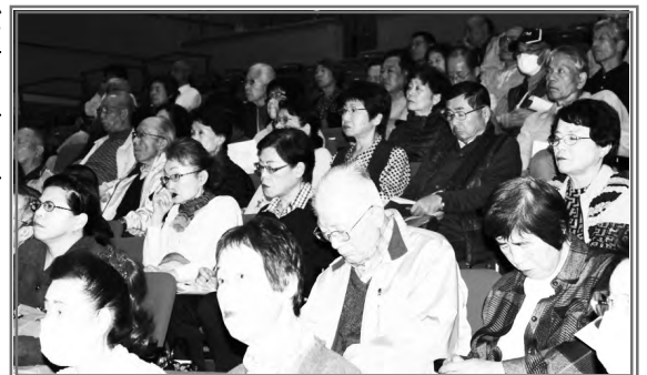
熱心に講演を聞く参加者