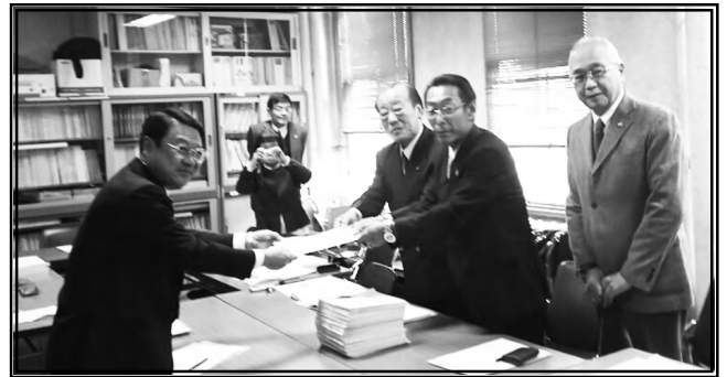
名古屋市健康福祉局に陳情署名提出