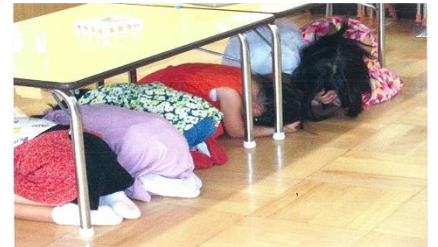
↑安城市立えのきこども園でのシェイクアウトの様子 (2021年)