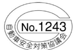
統一的なリコールステッカー

令和2年11月1日以降のリコールからステッカー貼付は廃止となります（令和2年10月31日までにリコールを届出した全ての案件も貼付を廃止）。ただし、各自動車メーカーが独自に設定したステッカーを貼付する場合があります。