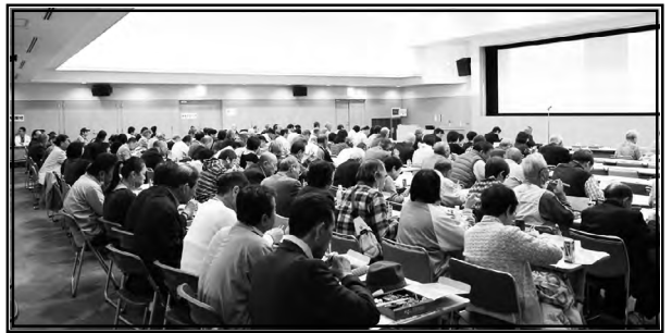
定期大会昼食風景