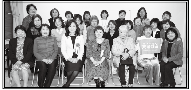
講師と来賓と参加者が一緒に記念撮影

第2部の交流会では、5グループに分かれて、お茶とお菓子を手に、 普段の出来事や透析での事など話しに花を咲かせて楽しく交流し、いつの間にか予定の時間が過ぎてしまうほどでした。