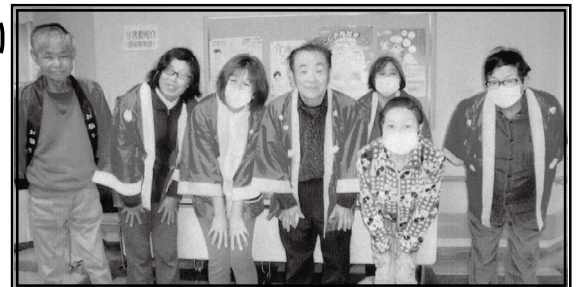
西三河本部 臓器移植キャンペーン記念撮影